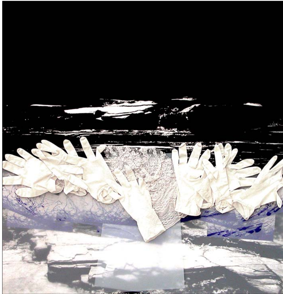
Galicia, 2006. Pintura, colage sobre serigrafía, 90 x 90 cm.