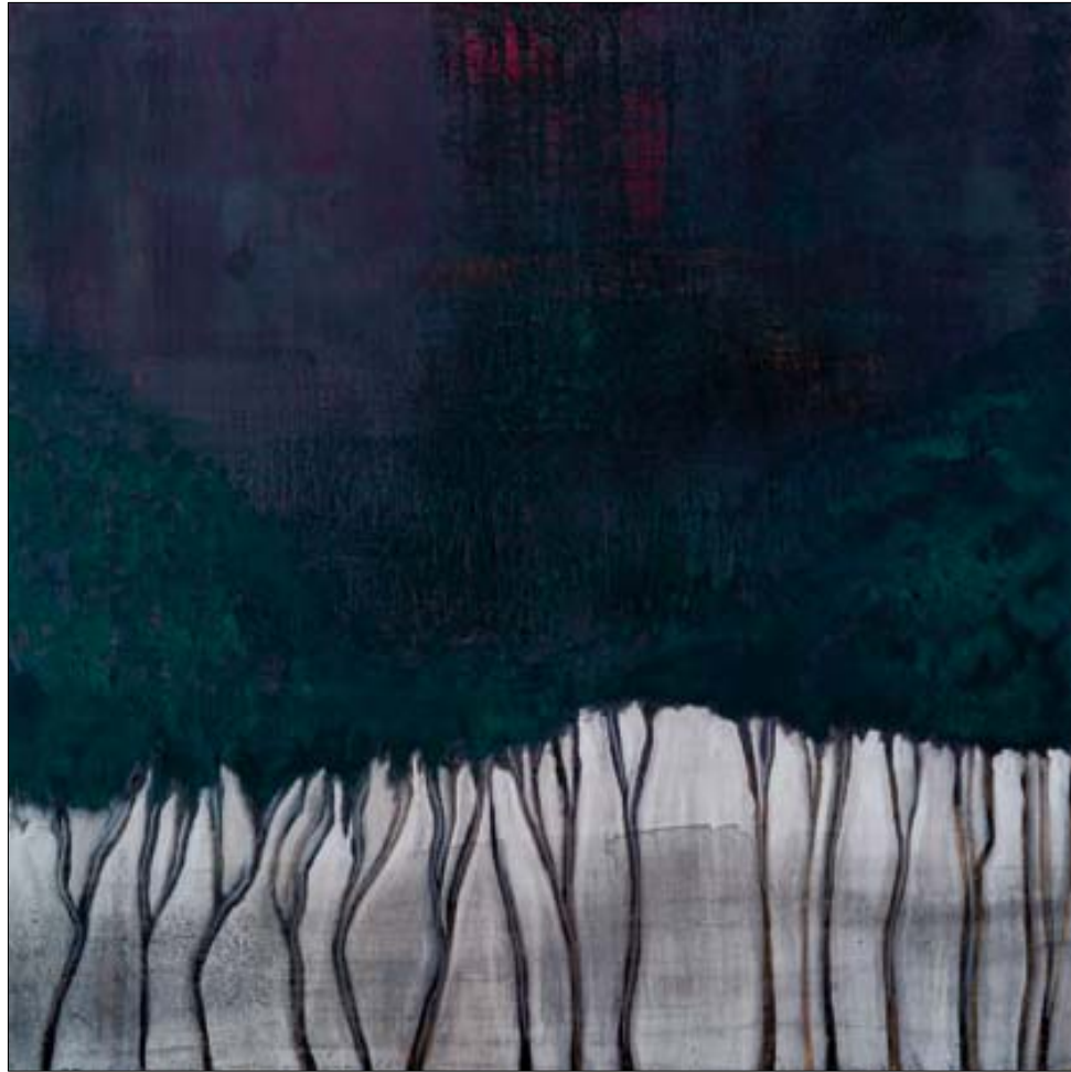
Sin título, 2007. Acrílico / tela, 145 x 145 cm.