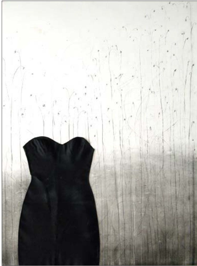
Sin título, 2005. Pintura, colage sobre serigrafía, 150 x 105 cm.