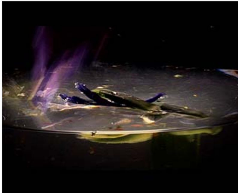
Dos secuencias del video "Gotescauen" 2007, duración: 6 min.