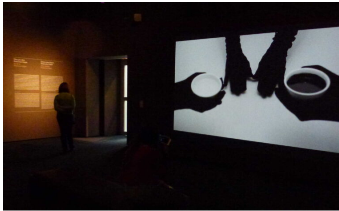
Una de les primeres imatges del vídeo Dins per dins.

El vídeo projectat a la paret i les fotografies han estat realitzades per Francesca Llopis a la Casa Gomis Bertrand (1949-1963), coneguda com La Ricarda, a El Prat de Llobregat. La gravació transcorre per l'interior d'aquest edifici paradigmàtic del moviment modern de la segona part del segle XX; un edifici de l'arquitecte Antonio Bonet Castellana dissenyat amb criteris racionalistes i funcionalistes que s'integra amb el paisatge d'una manera harmònica, oberta, orgànica i dialogant.