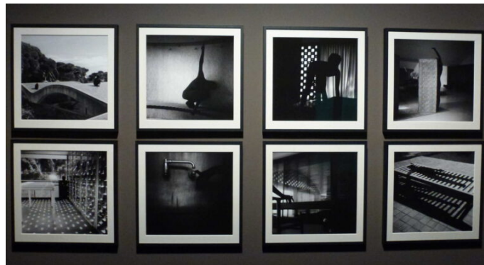
Vista del conjunt de les 8 fotografies en blanc i negre de Francesca Llopis.

La Casa Gomis-Bertrand (1957-1963), a més d'un esplèndid edifici, és també un indret que roman ancorat en el temps i en l'espai, carregat de records de tota mena– tan familiars com de la vida cultural i musical del nostre país– , un espai de pau, de tranquil·litat i de cultura agredit pels sorolls dels avions i amenaçat per la proximitat de l'aeroport.